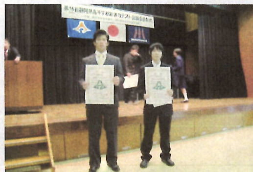
H27 静岡県高等学校新体力テスト記録会表彰式