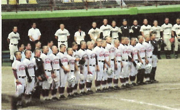
H28 野球部・浜松工業を撃破し校歌を歌う