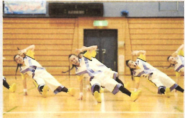
H28 ダンス部 全国高等学校ダンスドリル選手権大会(全国大会出場)