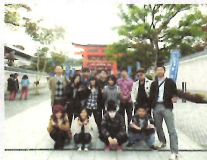
H27 定時制 修学旅行