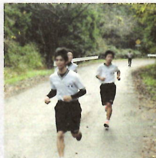
H27 全日制 クロスカントリー大会