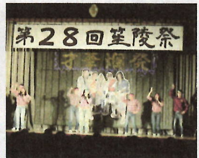
H28 全日制 笙陵祭文化の部(校内発表)