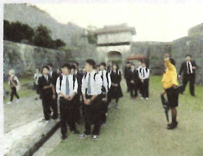
H27 全日制 沖縄への修学旅行