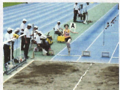
H27 全国高等学校定時制通信制陸上競技大会