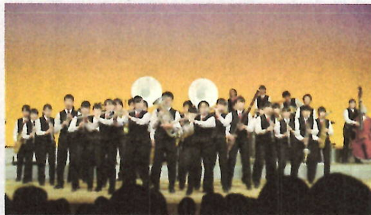
H28 吹奏楽部定期演奏会