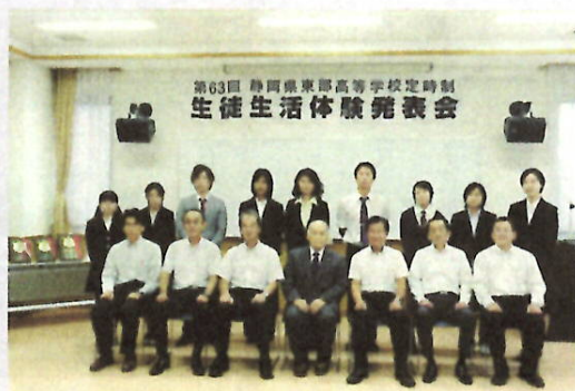
H27 静岡県東部高等学校定時制生活体験発表会