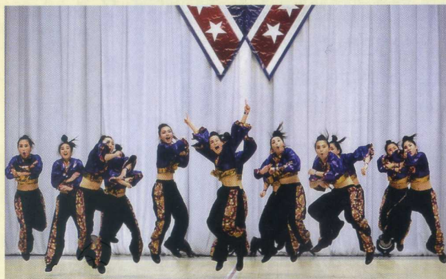
ダンス部(全国大会出場)