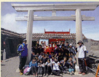
H25全日制富士山学習