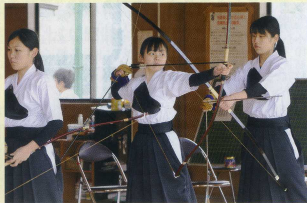
弓道部(東海大会出場)