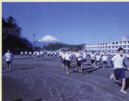
H24全日制クロスカントリー大会