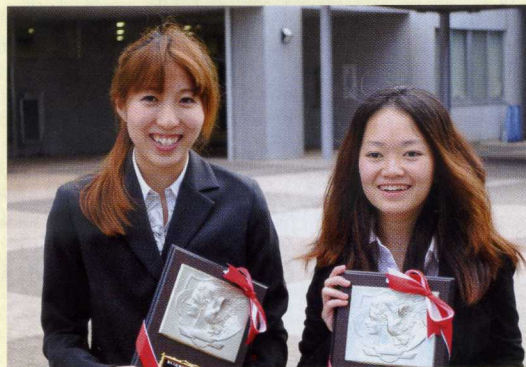
H24静岡県高等学校定時制通信制生徒生活体験発表会