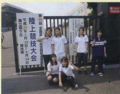
第48回全国高等学校定時制通信制陸上競技大会