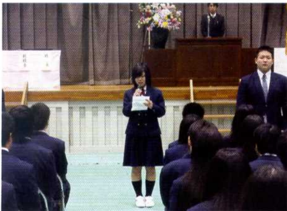
平成24年度同窓会入会式

静岡県立小山高等学校は、昭和六十年に地域の皆様の期待のもと、静岡県東部のこの北駿の地に設立されました。本校は、平成二十六年に創立三十周年を迎えます。 そこで、創立三十周年を記念し、平成二十六年十一月一日(土)に記念行事開催を計画しています。 現在、学校・同窓会・PTA・後援会が協力し、取り組んでいる周年行事の計画を一部紹介します。 ① 記念式典の開催 ② 三十周年記念誌の発行 ③ 学校支援事業の取組