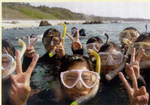
H24全日制修学旅行 沖縄 マリン体験