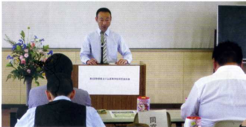
第6回静岡県立小山高等学校同窓会総会

静岡県立小山高等学校は、昭和六十年に地域の皆様の期待のもと、静岡県東部のこの北駿の地に設立されました。本校は、平成二十六年に創立三十周年を迎えます。 そこで、創立三十周年を記念し、平成二十六年十一月一日(土)に記念行事開催を計画しています。 現在、学校・同窓会・PTA・後援会が協力し、取り組んでいる周年行事の計画を一部紹介します。 ① 記念式典の開催 ② 三十周年記念誌の発行 ③ 学校支援事業の取組