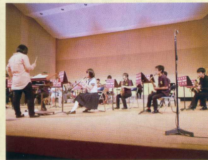
H25吹奏楽部定期演奏会